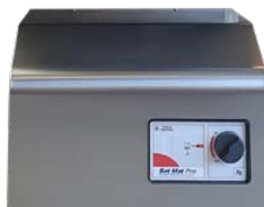
Version groupe HP mural Vendu seul